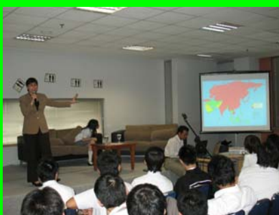
Seminar "Love, sex and dating" ... baca di hal. 8.