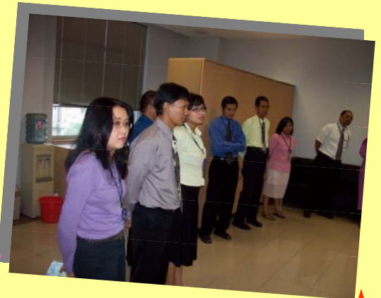
Beberapa staff Binus School yang hadir dalam peluncuran edisi perdana de' KurNas