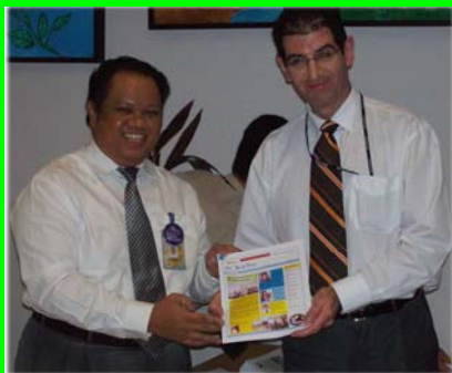
Launching de' KurNas ..... galeri foto di hal. 6.