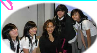
Ayu utami bersama para siswa

“... wajahnya kurus maski payudaranya mulai matang...”